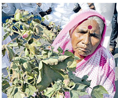
औरंगाबाद में गुरुवार को किसान इस तरह फसल व कर्ज माफी के पोस्टर लेकर रास्ता रोकने का आंदोलन में शामिल हुए