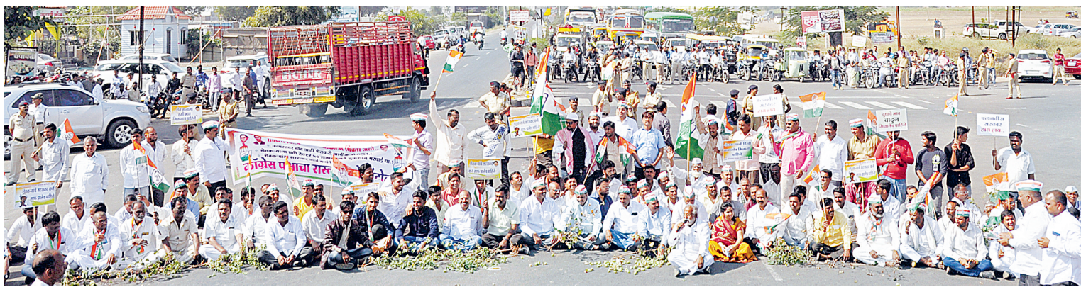
औरंगाबाद में गुरुवार को किसानों की समस्याओं को लेकर जालना रोड स्थित केंब्रिज स्कूल चौराहे पर रास्ता रोकने का आंदोलन करते हुए कांग्रेस कार्यकर्ता